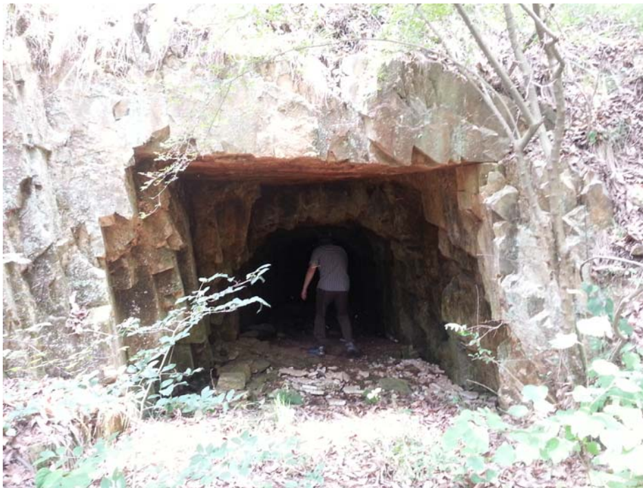
개소 : 옥포면 기세리 산68-1